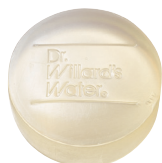
Dr.ウィラード・ フェイシャルソープ 90g 2,970円(税込)