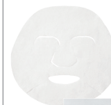
Dr.ウィラード・ うるおいチャージマスクVE 20mL×1枚 1,100円(税込)